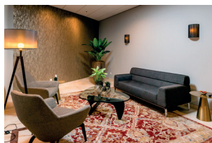
Familiekamer De Zwaan

De familiekamer kan op de afgesproken dag en tijdstip in gebruik worden genomen na uitleg door onze medewerker over het gebruik van de familiekamer en sleutel. Op de dag van vertrek wordt de overledene door onze medewerkers voor 08.30 uur uit de familiekamer gehaald.