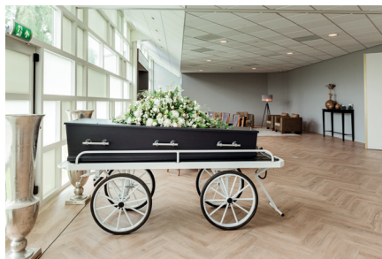
Aula Maassuite tot 30 personen