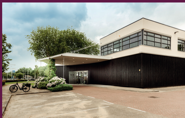
Crematorium & Uitvaartcentrum Memoriam

Een overzicht van de mogelijkheden en kosten