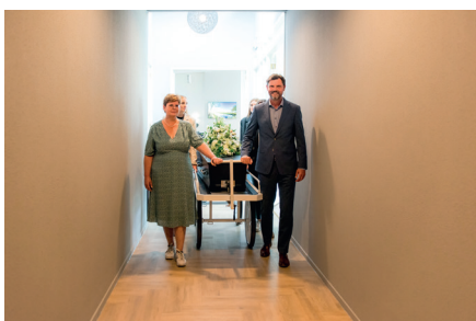
Begeleiding naar crematieruimte