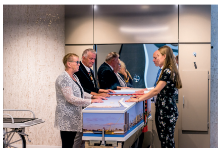
Laatste afscheid bij crematieruimte