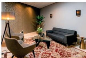
Familiekamer De Zwaan

De familie kamer kan op de afgesproken dag en tijdstip in gebruik worden genomen na uitleg door onze medewerker over het gebruik van de familie kamer en sleutel. Tenzij anders vooraf overeengekomen wordt op de dag van vertrek de overledene door onze medewerkers voor 08.30 uur uit de familie kamer gehaald.