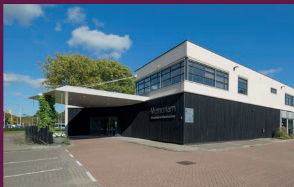
Crematorium & Uitvaartcentrum Memoriam

Een overzicht van de mogelijkheden en kosten