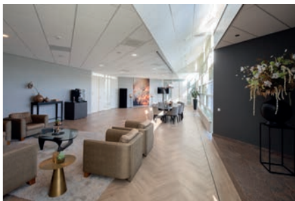
Aula Maassuite tot 30 personen