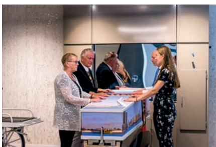
Laatste afscheid bij crematieruimte