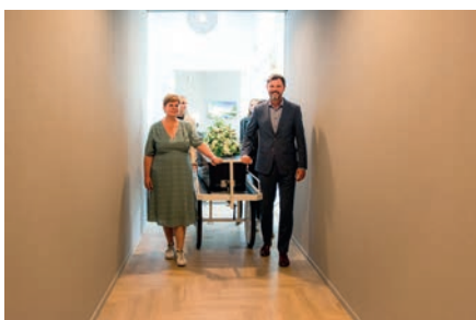
Begeleiding naar crematieruimte